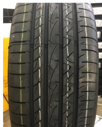
Imagem 1: Linhas na banda de rodagem de um pneu novo.

Em resumo, as linhas coloridas são aplicadas pela fábrica para que internamente consigam fazer um controle visual para fácil identificação e organização dos produtos, não estão relacionadas à qualidade do produto.