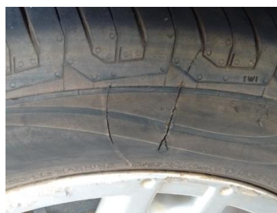
Imagem 2: Exemplo de corte lateral.

A banda de rodagem é a parte do pneu que entra em contato direto com o solo. Mesmo possuindo uma grande resistência à abrasão, também está sujeita a diversas avarias como perfurações, cortes, arrancamentos, etc. Esses danos, se forem muito profundos, podem acabar retirando o pneu de serviço.